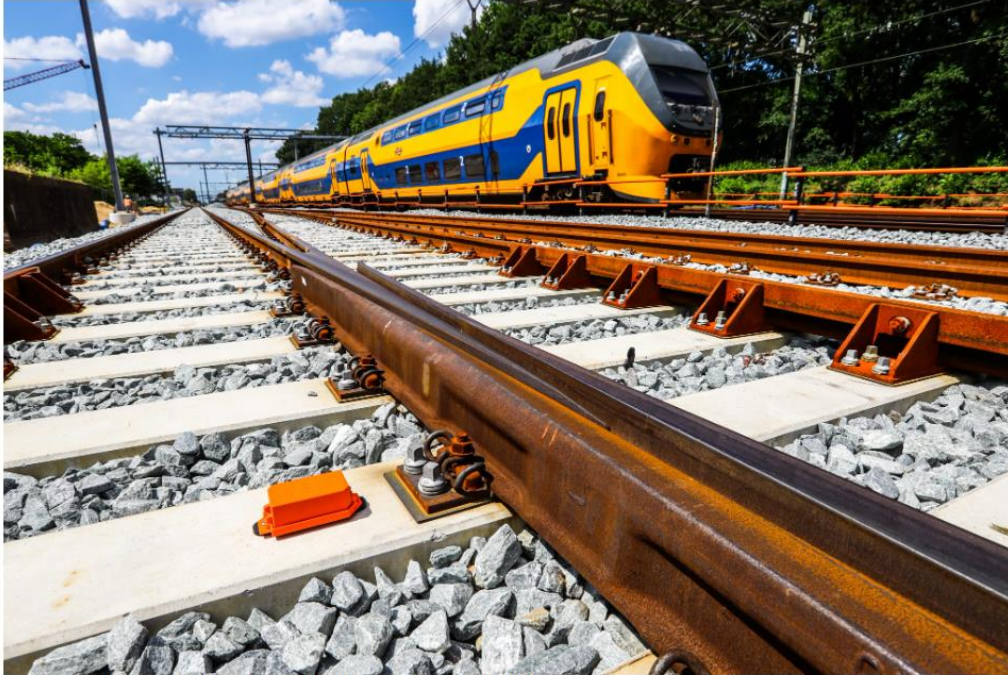
Een sensor van Rail 1435 langs het spoor

Binnenkort openen bedrijven en organisaties uit alle hoeken van de spoorsector hun deuren voor het brede publiek. Op 19 en 20 september vindt namelijk de derde editie van de Raildagen plaats. Wat beweegt bedrijven om hieraan mee te doen? SpoorPro sprak met enkele deelnemers, waaronder Rail 1435.